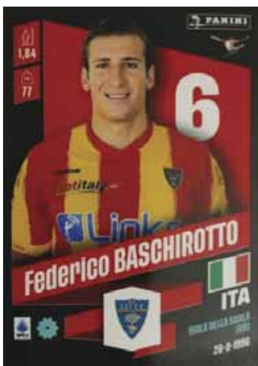
Una figurina Panini della collezione 2022-2023

Dopo Lecce, il Panini Tour 2023 proseguirà a Napoli (4-5 marzo), Roma (11-12 marzo), Firenze (18-19 marzo), Genova (25-26 marzo) e Milano (1-2 aprile).